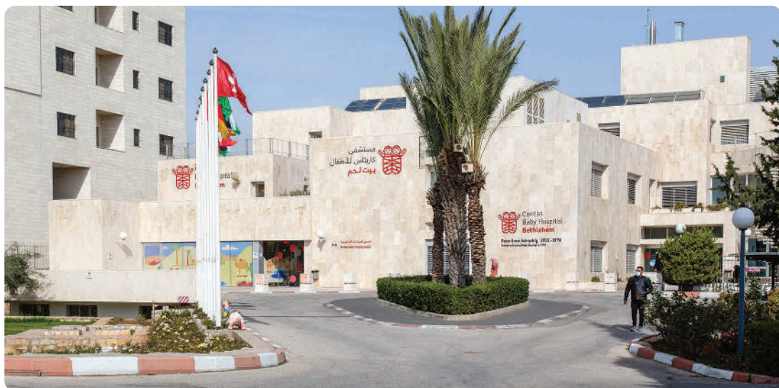
Das Caritas Baby Hospital in Bethlehem, Westjordanland: Es steht unter Schweizer Patronat und ist seit seiner Gründung 1953 ein Hoffnungsschimmer für kranke Kinder und deren Familien in dem von Elend und Krieg heimgesuchten Palästina