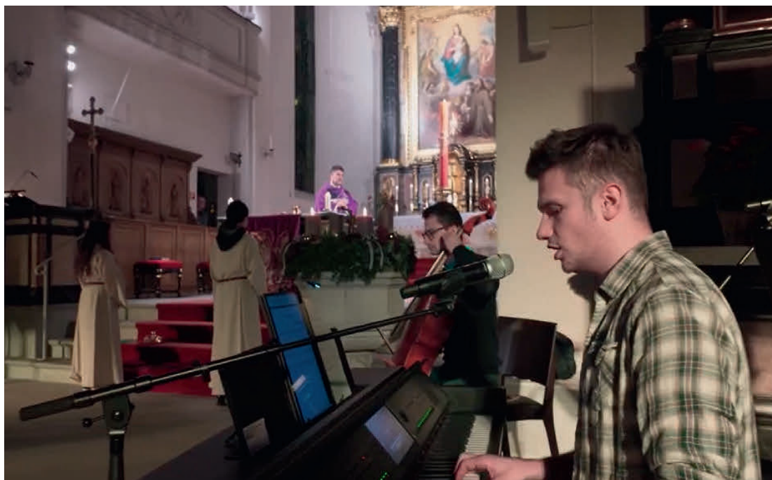
Die Jugendband des WJT begleitete die Feier mit einfühlsamen Stücken.

Der WJT-Warm-up-Abend war nicht nur eine Information über den Weltjugendtag, sondern ein konkretes Erleben von lebendiger Kirche – getragen von jungen Menschen, Musik, Glauben und Gemeinschaft.