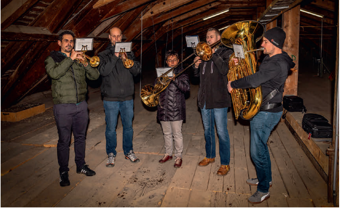
Die Turmbläser des Musikvereins begrüßten die Gläubigen am Heiligabend mit stimmungsvollen Klängen vom Kirchturm . . .