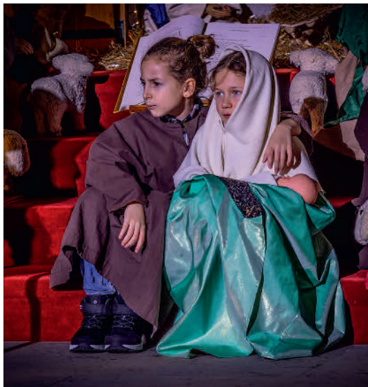
Die 3.-Klässler spielten beim Krippenspiel begeistert die Figuren von Josef, Maria und den Hirten.