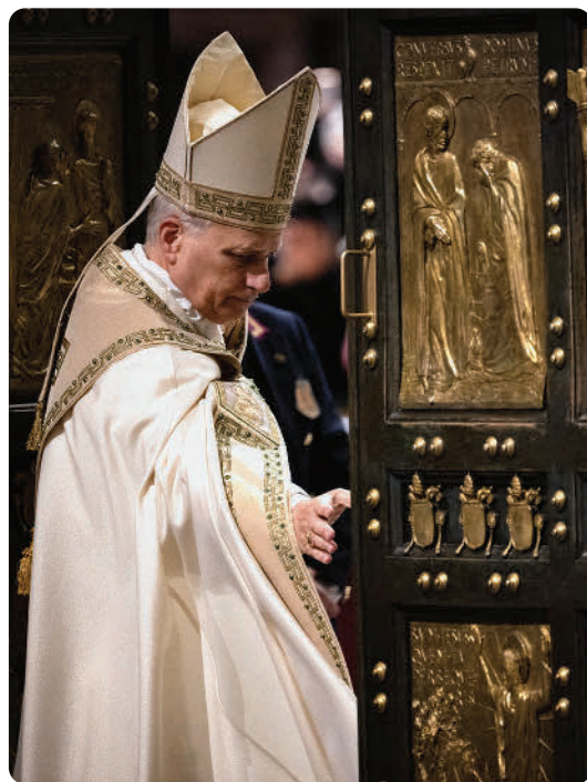
Leo XIV. schliesst die Heilige Pforte in St. Peter