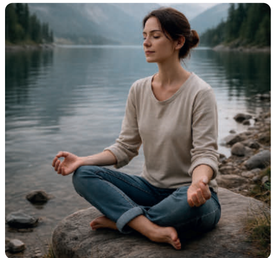
In der Stille der Meditation wandeln sich unsere Ziele

Im Christentum hat Jesus von Nazareth Zeit seines Lebens für die Nächstenliebe geworben und in der Psychotherapie spricht man von Einfühlungsvermögen und bedingungsloser Wertschätzung. Diese Haltung ist, wissenschaftlich gesichert, wichtiger als die tatsächlich praktizierte psychologische Methode. Folglich schrieb vor Jahren der Chefarzt einer renommierten Suchtfachklinik als Überschrift zu einem Fachartikel