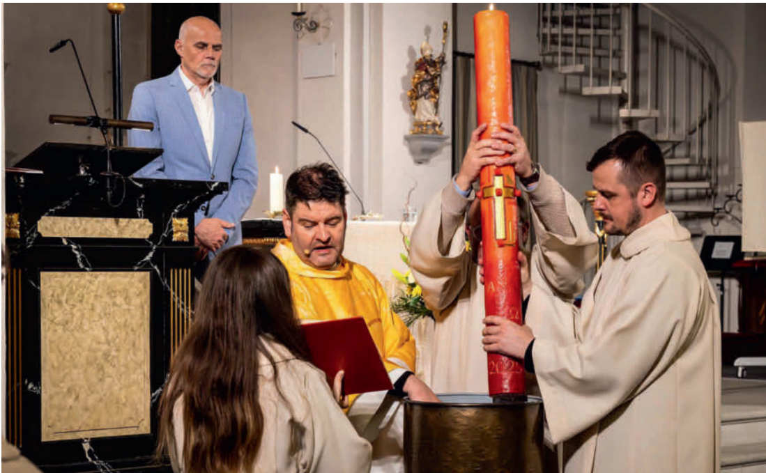
...und danach in der Kath. Kirche bei der Segnung der Osterkerze.