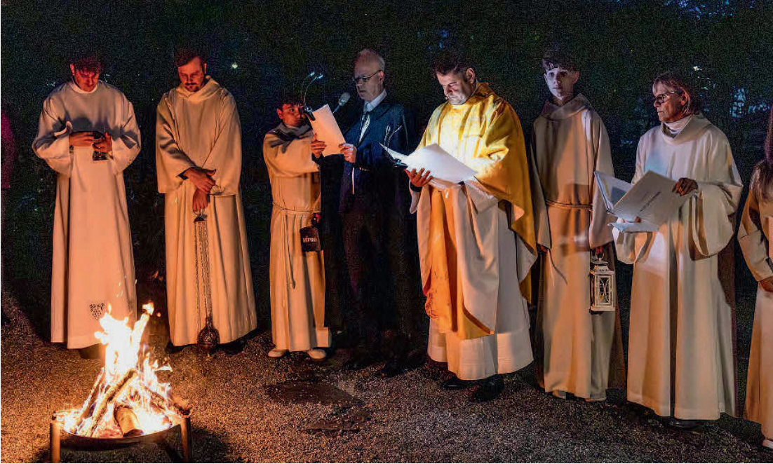
Stimmungsvolles Osterfeuer 2025 bei der reformierten Kirche...