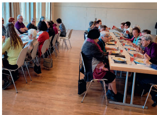
Die anwesenden Gäste genossen das schmackhafte Gemüserisotto.

Herzlichen Dank auch Ihnen allen für Ihre grosszügigen Spenden zu Gunsten des Projekts «Madagaskar». Wir freuen uns, Sie auch im kommenden Jahr wieder begrüssen zu dürfen.